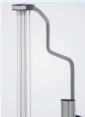
Kabelarm ergo vac LT

Mit der Elektrodenanlage ergo vac (inkl. ergo vac LT ) führen Sie Ruhe- und Belastungs-EKG-Messungen schnell und komfortabel durch. Die ergo vac ist für alle EKG-Gerätetypen geeignet und kann an verschiedenen Wagensystemen montiert werden. Bei Bedarf bieten wir auch kundenspezifische Halterungen. ergo vac verfügt ebenfalls über eine Ausblasfunktion, um Feuchtigkeit und Verunreinigungen auszublasen.